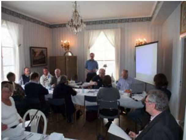
Säkerhetsfrågor var ett viktigt ämne under Båt dagen