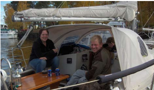
Mitten: Höstseglande Smaragd och "Tallisfyren" Nederst: Höstseglare vid Talklubben