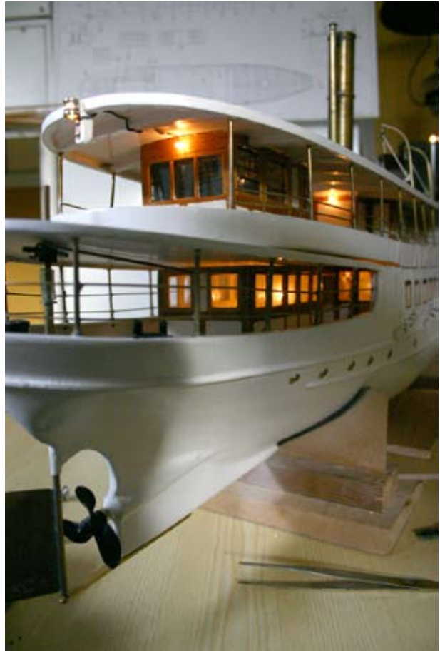
Modellbygget av "Mariefred" närmar sig en sjösättning och kommer då att manövreras med en radioenhet.