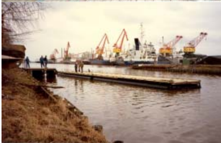
Brygga till Kråkan Byggår 1987

Det är rejäla ting och arbetsviljan tycks god.