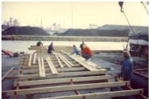
Kommer ni ihåg: Bryggor till Kråkan 1985