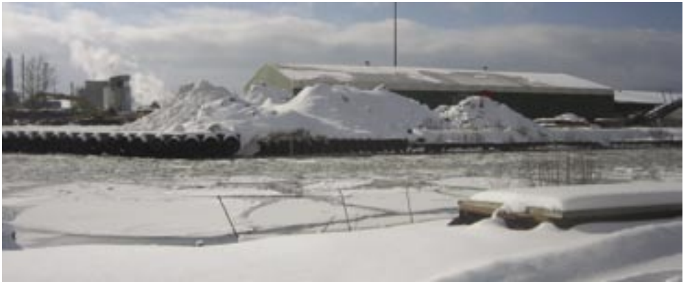
Stora snömassor väntar på vårens värme

- Det vet jag inte. Men en sak är klar. Den här gången följer jag med.