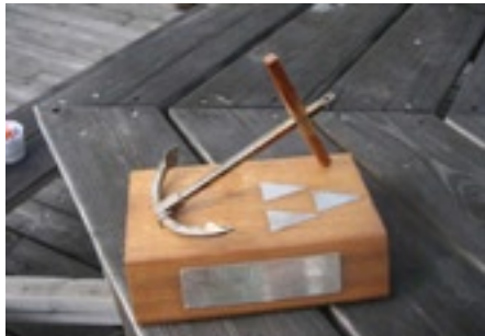
Vandringspriset tillhör numera KMBK