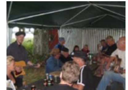
Internationella sänger framfördes