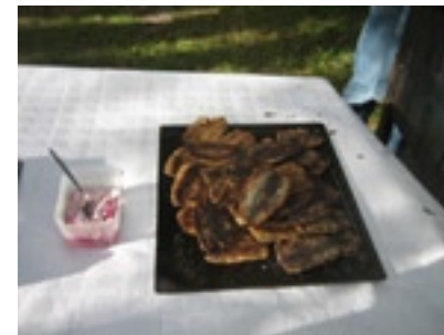
Delikatesser från kockarna