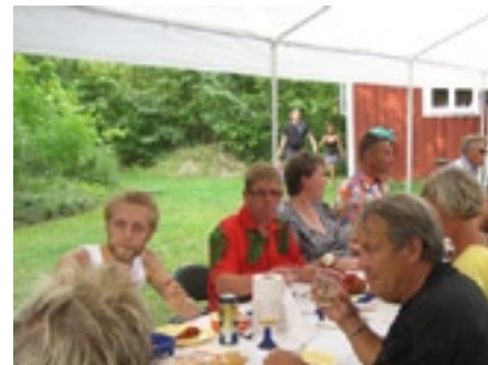
Kräftfest på Sävis