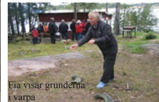
Fia visar grunderna i varpa