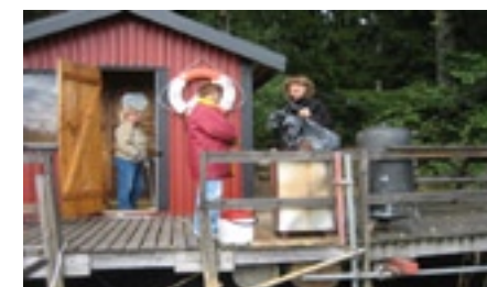
Rent och fint i bastun blev det