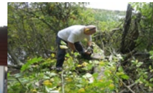
Jouni röjer sly