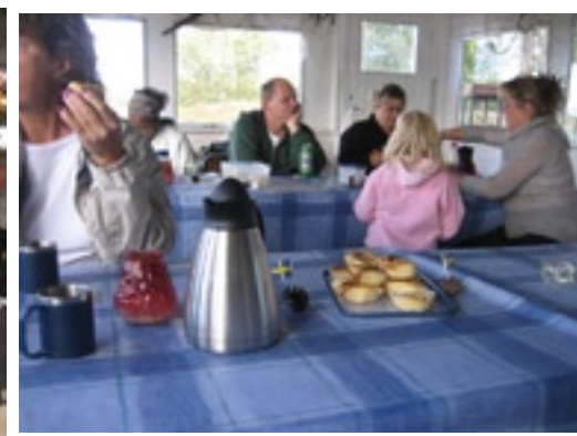
Äter, fikar och trivs i glada vänners lag.